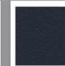
LEATHER LOOK BLACK (760)