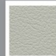
LEATHER LOOK ARGENT (709)