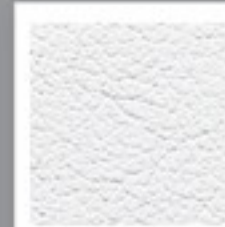
LEATHER LOOK WHITE (700)